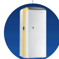
GTU 1200 V