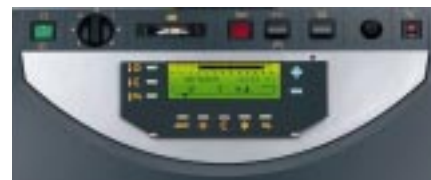
a) Regulator DIEMATIC ze zdalnym sterowaniem

Nowa generacja palników do nowych typoszeręgów kotłów grzewczych. Nowe nadmuchowe palniki gazowe G 100 względnie olejowe M 100 gwarantują wszechstronny komfort. Czyste spalanie paliw zapewnia niską emisję substancji szkodliwych, jak również cichą pracę. Za pomocą tylko jednego dostarczonego klucza można je zamontować i regulować.