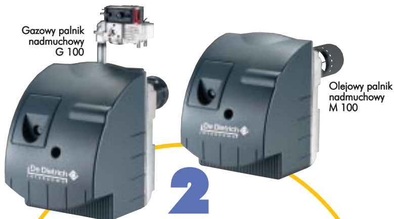
Olejowy palnik nadmuchowy M 100