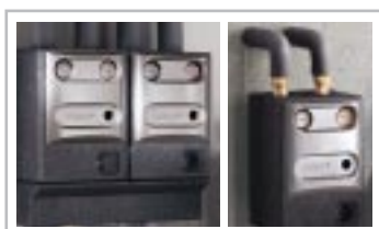
Grupy szybkiego montażu

System GT 120 zrealizuje filozofię: dla realizacji osobistych wymagań proponujemy komponenty wyposażenia dodatkowego, takie jak: regulatory, palniki, podgrzewacze c.w.u. lub hydrauliczne zespoły przyłączeniowe. Niepowtarzalny w formie i funkcjonowaniu jest np. GT 1200V, jako bardzo kompaktowa centrala grzewcza olejowa/gazowa, bardzo przyjazna w instalacji i oszczędzająca miejsce poprzez zintegrowany leżący podgrzewacz 130 litrowy. Wszystkie komponenty systemu GT120 zaprojektowane są dla ewentualnej rozbudowy w przyszłości. Wszystko to celem zwiększenia wydajności, dłuższej żywotności i jeszcze większej perfekcji – od detalu do całości.